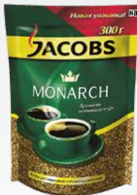
КОФЕ JACOBS MONARCH, натуральный растворимый сублимированный, 300 г