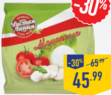
СЫР МОЦАРЕЛЛА ЧИСТАЯ ЛИНИЯ, в рассоле, 100 г