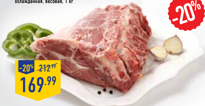
СВИНАЯ ШЕЯ НА КОСТИ, охлажденная, весовая, 1 кг