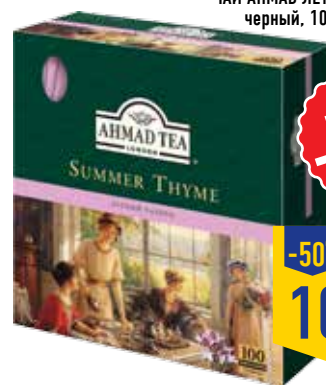
ЧАЙ АХМАД ЛЕТНИЙ ЧАБРЕЦ, черный, 100 пак., 180 г