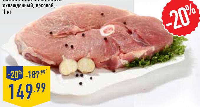
СВИНОЙ ОКОРОК НА КОСТИ, охлажденный, весовой, 1 кг