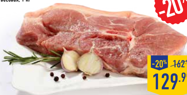
СВИНАЯ ЛОПАТКА НА КОСТИ, охлажденная, весовая, 1 кг