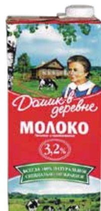
МОЛОКО ДОМИК В ДЕРЕВНЕ, стерилизованное, 3,2%, 950 г