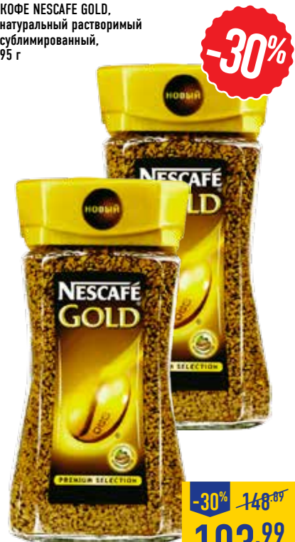
КОФЕ NESCAFÉ GOLD, натуральный растворимый сублимированный, 95 г