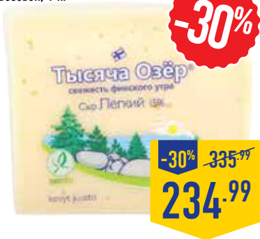
СЫР ТЫСЯЧА ОЗЕР ЛЕГКИЙ, 15%, весовой, 1 кг