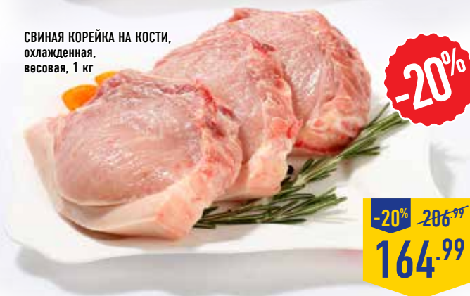
СВИНАЯ КОРЕЙКА НА КОСТИ, охлажденная, весовая, 1 кг