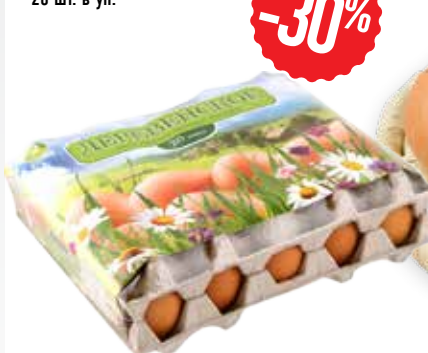
СТОЛОВОЕ ЯЙЦО РОСКАР, деревенское, С1, 20 шт. в уп.