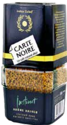
КОФЕ CARTE NOIRE, растворимый сублимированный, 95 г