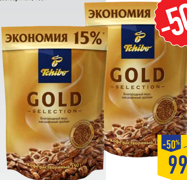
КОФЕ TCHIBO GOLD SELECTION, растворимый, 150 г