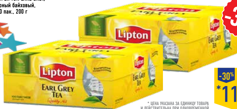
ЧАЙ LIPTON EARL GREY, черный байховый, 100 пак., 200 г